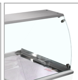
Cristal curvado para mayor visibilidad