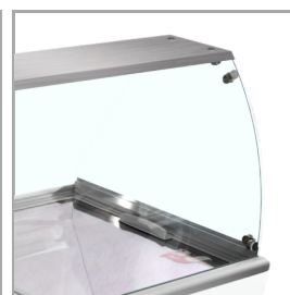
Cristal curvado para mayor visibilidad