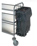
Accesorios para carros de servicio estándar