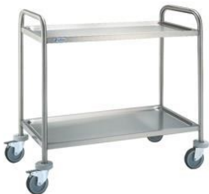
Distribución y exposición de alimentos - Carros - Carros de servicio estándar y reforzados