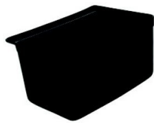
Accesorios para carros de servicio