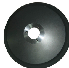
Cortadora de fiambres Gama Estándar Accesorios