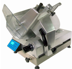
Cortadoras profesionales de engranajes