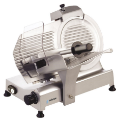
Cortadoras de fiambre profesional