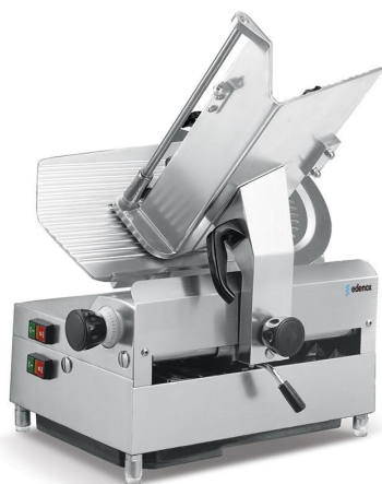
Preparación dinámica y conservación - Cortadoras de fiambres - Cortadora de fiambres Gama Estándar