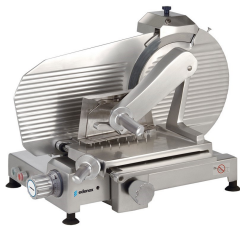
Cortadoras profesionales verticales