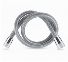
Grifería industrial Accesorios