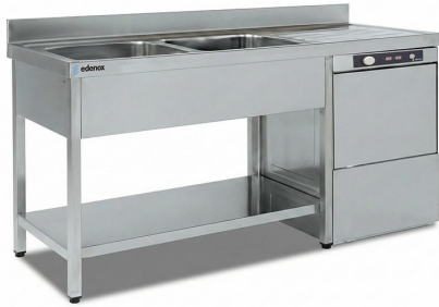
Preparación estática - Fregaderos industriales - Fregaderos industriales - Soldados a bastidor gama 600 y 700 - Gama lavavajillas