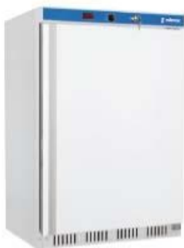
Frio Comercial - Armarios refrigerados en ABS - Armarios refrigerados