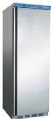
Frio Comercial - Armarios refrigerados en ABS - Armarios refrigerados