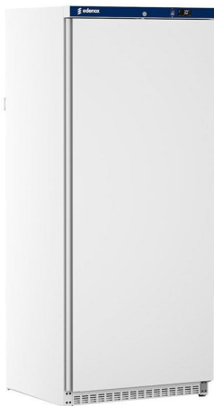
Frio Comercial - Armarios refrigerados en ABS - Armarios refrigerados