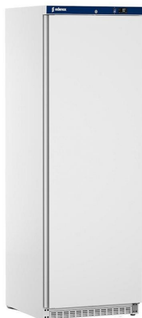
Frio Comercial - Armarios refrigerados en ABS - Armarios refrigerados