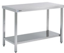
Mesas de trabajo murales y centrales Centrales profundidad 500