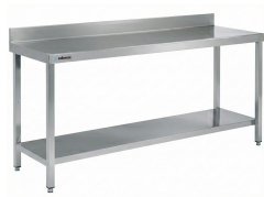
Mesas de trabajo murales y centrales Murales profundidad 500