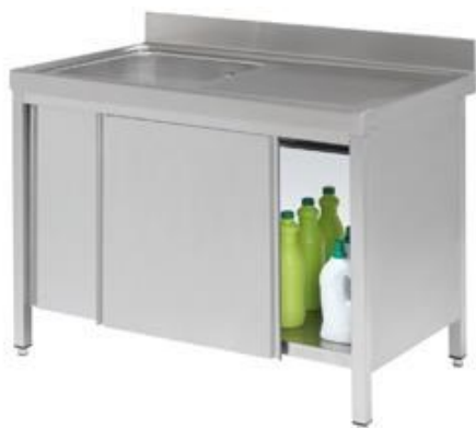
Preparación estática - Fregaderos industriales - Fregaderos soldados con puertas