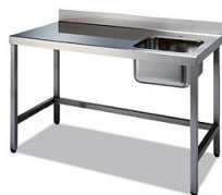
Mesas murales con cubeta