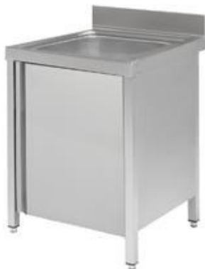
Preparación estática - Fregaderos industriales - Fregaderos soldados con puertas