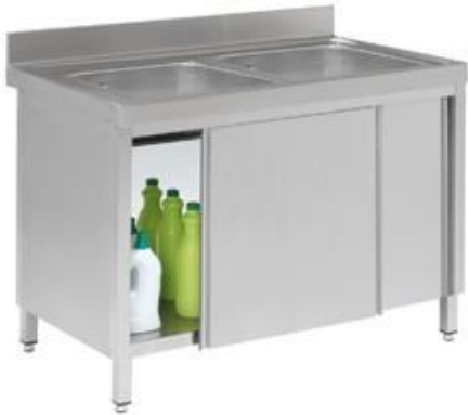
Preparación estática - Fregaderos industriales - Fregaderos soldados con puertas