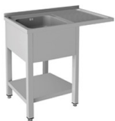
Fregaderos industriales Soldados a bastidor Gama 500 y 550 - Gama Lavavajillas