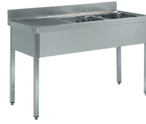
Fregaderos industriales Soldados a bastidor gama 600 y 700 - Gama lavavajillas