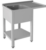
Fregaderos industriales Soldados a bastidor Gama 500 y 550 - Gama Lavavajillas