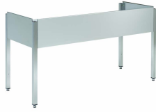
Bastidores para fregaderos de gamas 600 y 700