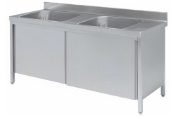
Fregaderos soldados con puertas