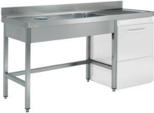
Preparación estática - Fregaderos industriales - Fregaderos especiales