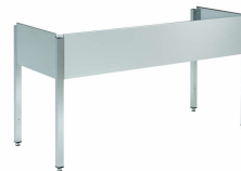
Bastidores para fregaderos de gamas 600 y 700