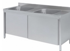
Fregaderos soldados con puertas