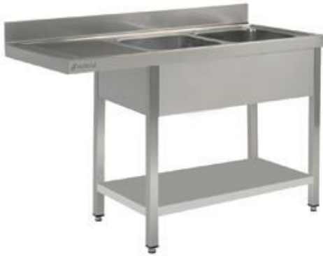
Preparación estática - Fregaderos industriales - Fregaderos industriales - Soldados a bastidor gama 600 y 700 - Gama lavavajillas