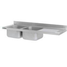
Fregaderos industriales Gama 700