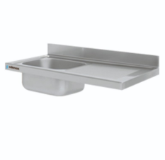
Fregaderos industriales Gama 600