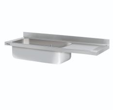
Fregaderos industriales Gama Gran Capacidad