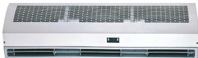
Mod. Sólo Aire