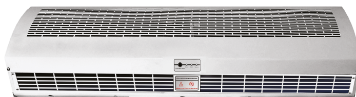
Mod. con Calefacción