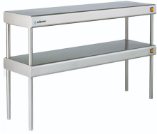
Esteras sobremesa Con luz y calor