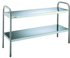
Esteras sobremesa Neutras